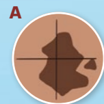
A Asymmetrie (ungleichmäßige Form)

Bei der Kontrolle deiner Pigmentflecken kannst du dich an der ABCDE-Regel orientieren. Wenn eines oder mehrere dieser Merkmale auf einen Pigmentfleck zutreffen, gilt er als auffällig. Das bedeutet nicht, dass du Krebs hast! Du solltest bei diesen Flecken jedoch auf Veränderungen achten.