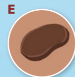
E Entwicklung & Erhabenheit