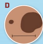
D Durchmesser (≥ 5 mm)